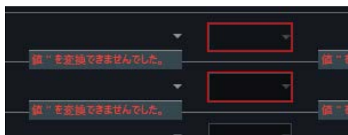
Windows10 バージョン 1903 の場合